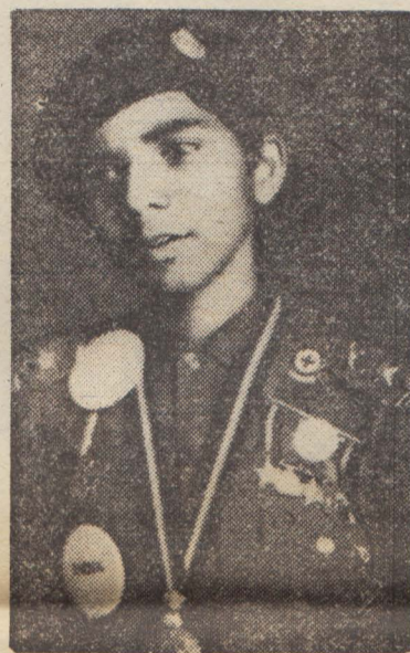
ТВОЙ ЗАРУБЕЖНЫЙ РОВЕСНИК

НА СНИМКАХ: И. Д. Папанин, Е. К. Фёдоров, Э. Т. Кренкель, П. П. Ширшов.